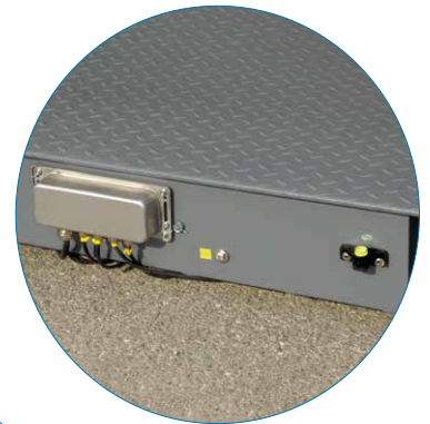
Caja de unión de acero inoxidable